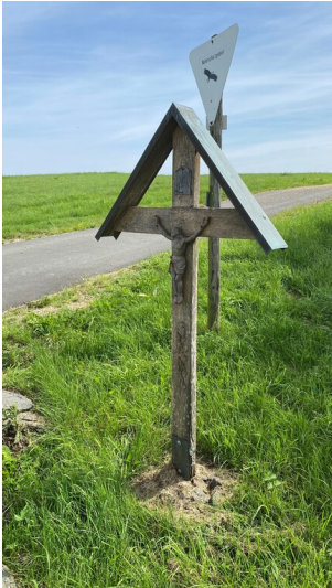
Schlichtes Dachkreuz aus Holz mit Christuskorpus bei Schüller (2023)