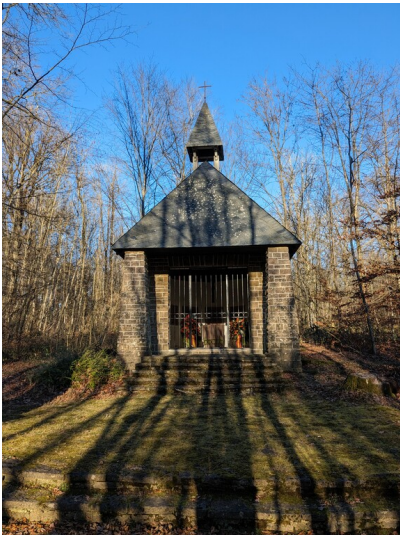
Kriegergedächtniskapelle bei Metterich (2024)