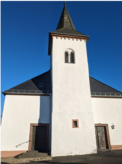
Katholische Pfarrkirche St. Nikolaus in Bitburg-Mötsch (2023)