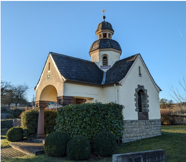
Kriegergedächtniskapelle in Idesheim (2023)