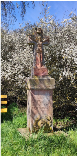
Wegekreuz zwischen Ohlert und Mutscheid aus rotem Sandstein