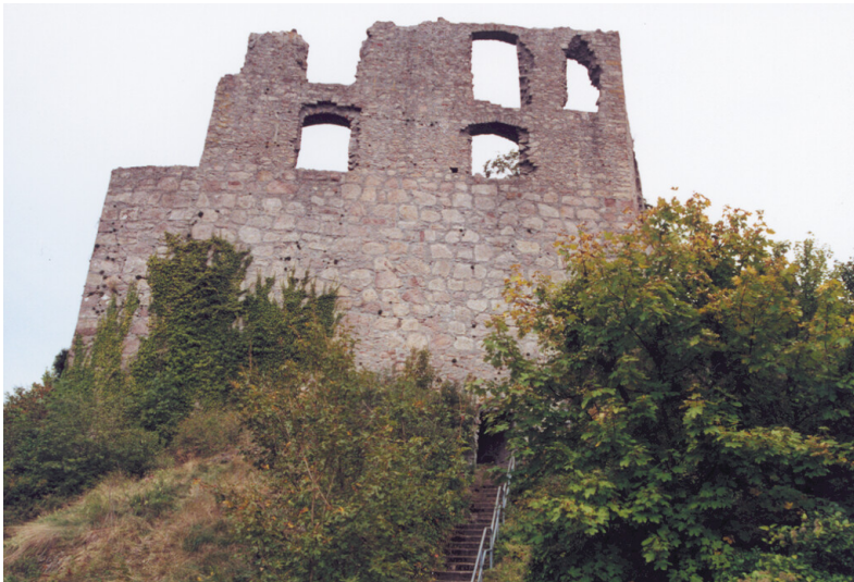
Westseite des Wohnbaus