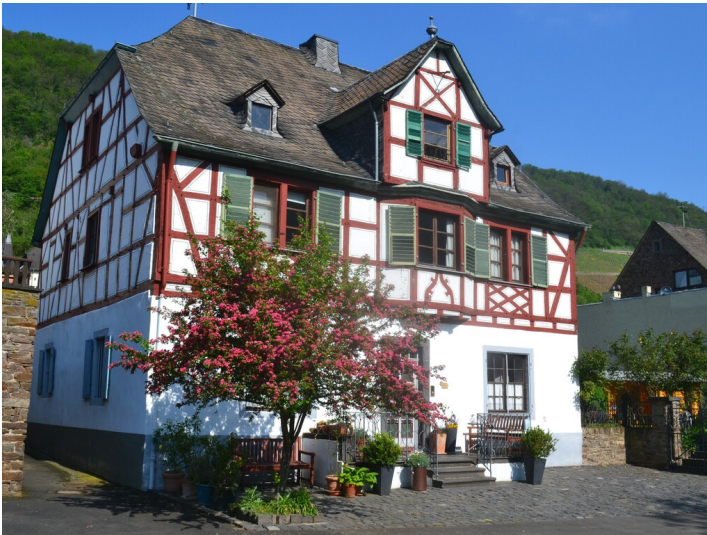
Das Halfenhaus in Moselkern (2023)