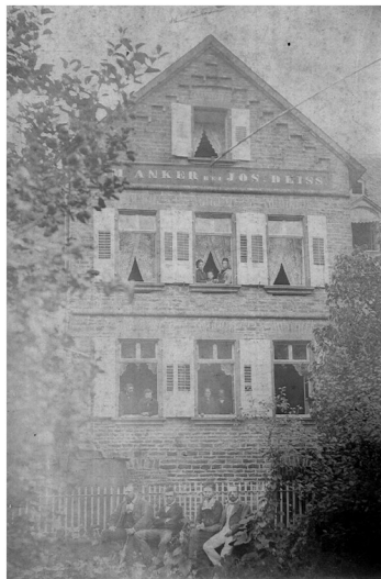
Historische Ansicht des Gasthauses "Zum goldenen Anker" im Anwesen Moselstraße 10/Zehnthofstraße 3 in Moselkern (um 1890)

Schlagwörter: Zehnthaus Fachsicht(en): Landeskunde Gemeinde(n): Moselkern Kreis(e): Cochem-Zell Bundesland: Rheinland-Pfalz