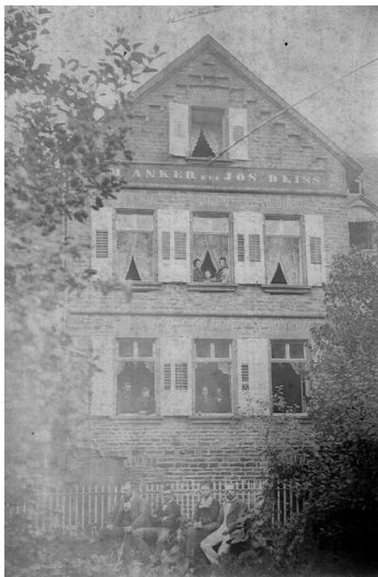
Historische Ansicht des Gasthauses "Zum goldenen Anker" im Anwesen Moselstraße 10/Zehnthofstraße 3 in Moselkern (um 1890)

Schlagwörter: Zehnthaus Fachsicht(en): Landeskunde Gemeinde(n): Moselkern Kreis(e): Cochem-Zell Bundesland: Rheinland-Pfalz