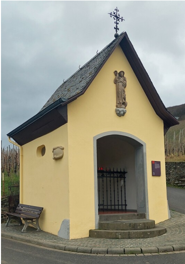
Die Sankt-Josefs-Kapelle in den Weinbergen oberhalb von Bernkastel-Kues (2023).