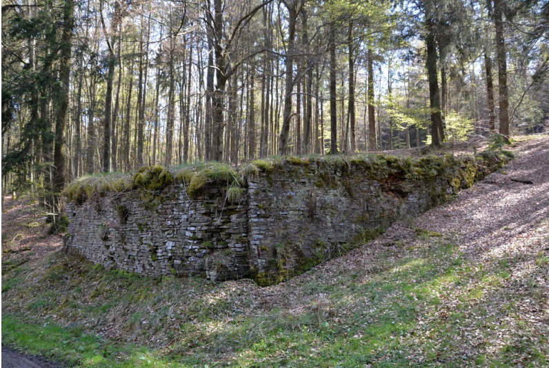
Skisprungschanze (Adolf-Hitler-Schanze)