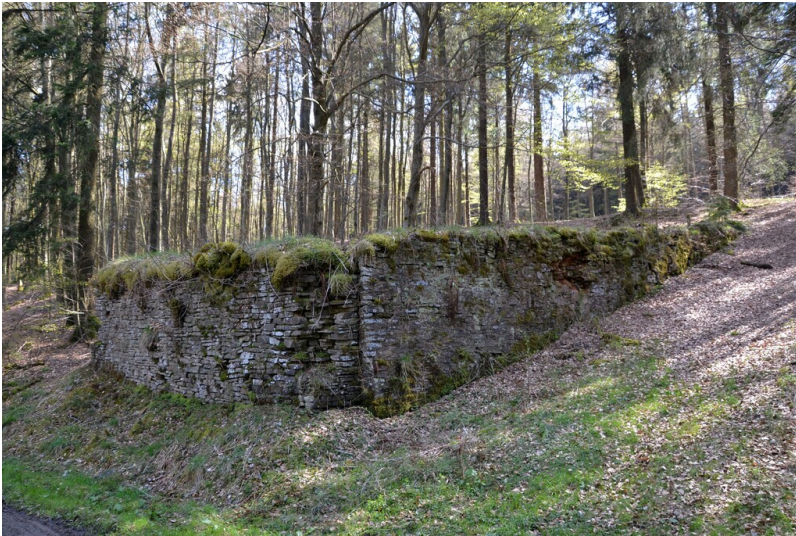
Skisprungschanze (Adolf-Hitler-Schanze)