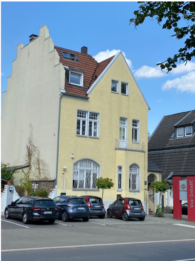
Zeitweise als Betriebsleiterwohnung des Werkes Grosspeter-Lindemann genutztes Wohnhaus an der Aachener Straße (2024)