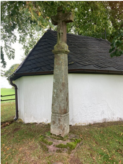
Wegekreuz bei der Matthiaskapelle