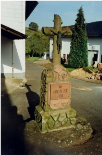
Wegekreuz „Auf der Grub“ in Duppach