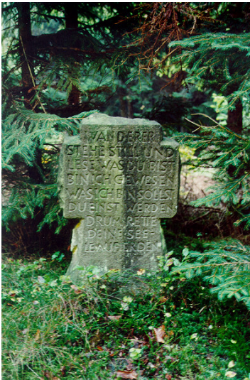
Wegekreuz „Am Rennpfad“