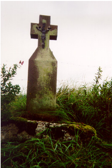
Wegekreuz "Hinter der Rausch"