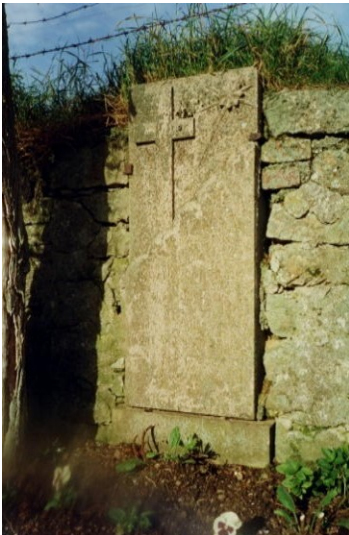
Wegekreuz "Auf dem hintersten Rech"