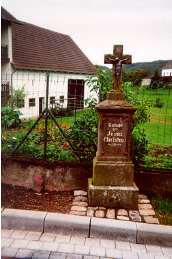
Wegekreuz "Auf Drisch"