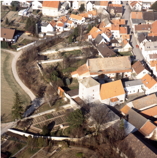
Wohnturm Dalberger Hof in Eppelsheim (1997)

Schlagwörter: Turmburg Fachsicht(en): Landeskunde Gemeinde(n): Eppelsheim Kreis(e): Alzey-Worms Bundesland: Rheinland-Pfalz