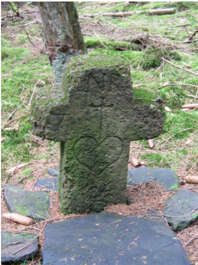
Wegekreuz "In der Taufbach" bei Roth