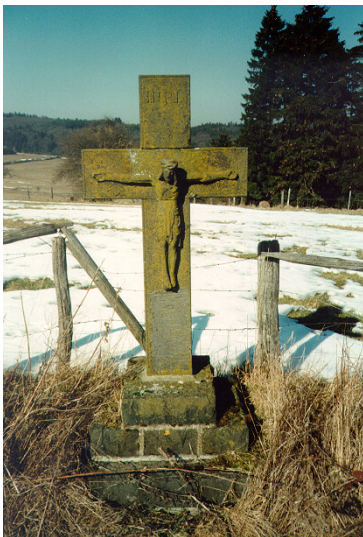
Wegekreuz "Im Schneeberg" beim Duppacher Maar