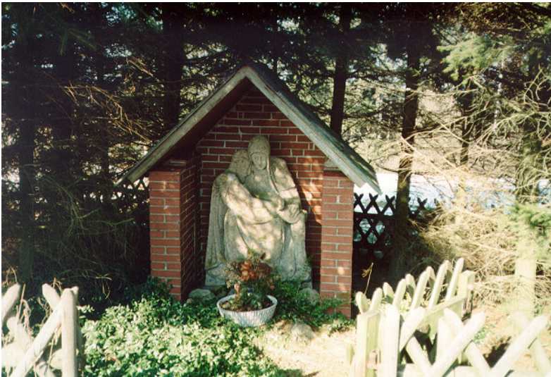
Pietà „Im Schneeberg“ beim Duppacher Maar Fotograf/Urheber: Paul, Surges