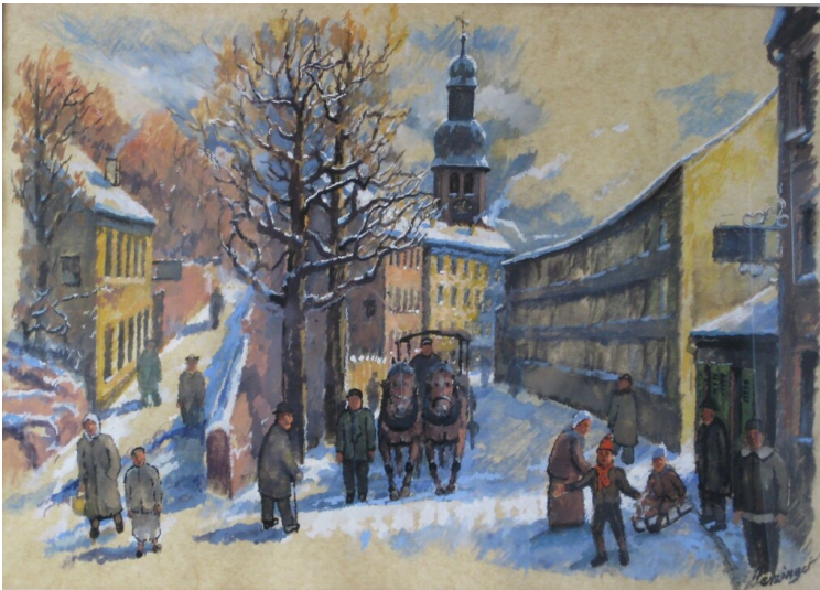
Idealisierte Zeichnung von Ludwig Petzinger mit dem Eingang zur Kaffeegasse links im Bild (19. Jahrhundert) Fotograf/Urheber: Ludwig Petzinger