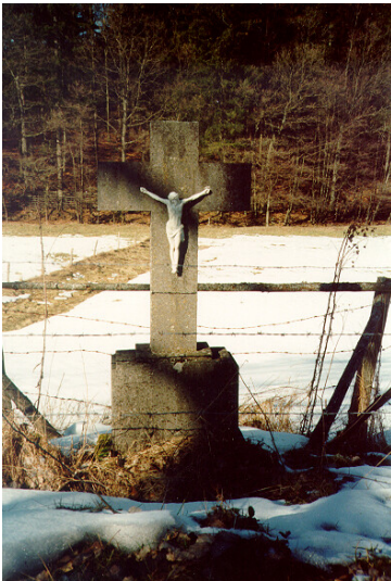
Wegekreuz beim Duppacher Maar