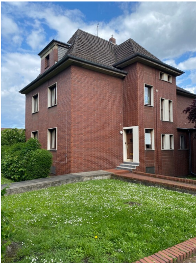
Wohnhaus der Fabrikantenfamilie Wolf an der Dürener Straße (2023)