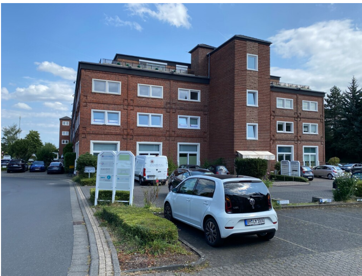
Ofenhaus des Steinzeugwerkes Grosspeter-Lindemann (2024)