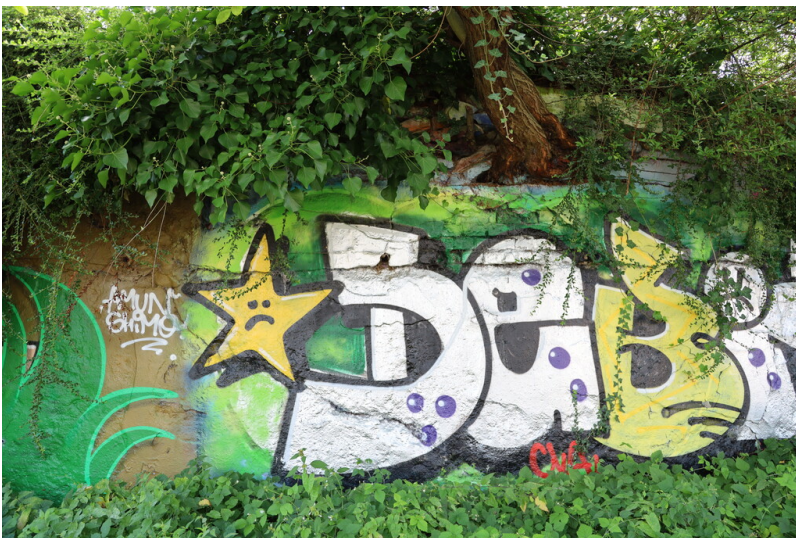
Grundstücksmauer der Steinzeugfabrik Grosspeter-Lindemann in Richtung Bahnhof Königsdorf (2024)