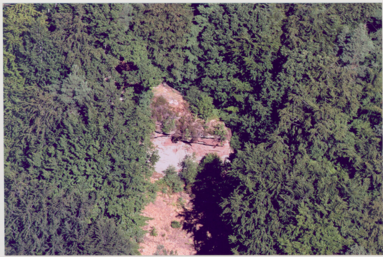
Luftaufnahme des Bruderfelsens bei Schönau (2003)