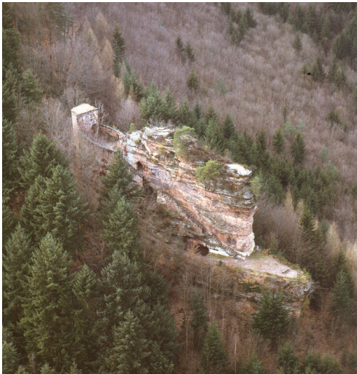
Burgruine Blumenstein bei Schönau