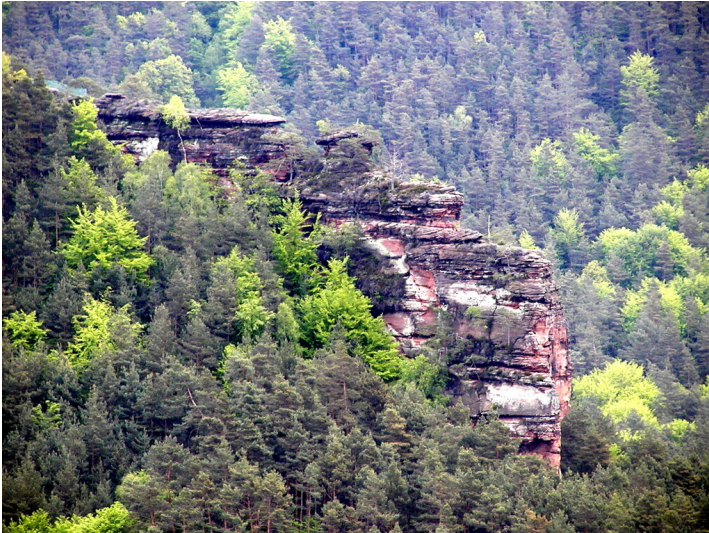
Burgruine Bachelstein bei Hauenstein (2005)