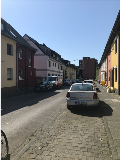
Siedlung Balkhausen in der Margaretenstraße 2-12 (2022)