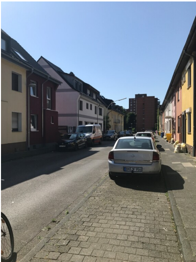
Siedlung Balkhausen in der Margaretenstraße 2-12 (2022)