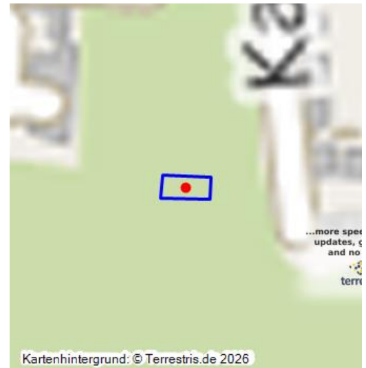
Grundriss der Burg Affelderle bei Wörth

Letztlich ist die Gründung von Burg Affelderle unbekannt. Manfred Bader, der sich auf überlieferte Flurnamenbelege (1574 allda etwan ein Schloß Streitberg genannt gestanden seyn soll) beruft, nimmt nicht unbegründet an, die Burg südwestlich der Stadt Wörth im Walddistrikt „Dorsch-Berg“ habe „ursprünglich den Namen „Streitberg,, getragen“ (Bader 1983, S. 144). Allgemein wird - im Anschluss an den Vorgenannten - vermutet, dass die heute Burg Affelderle genannte Anlage möglicherweise, der „Sicherung und Verwaltung des Rheinüberganges und der umliegenden, umfangreichen Frohnhofkomplexe (72 Hofgüter)“ (Keddigkeit 4 2021, S. 64) des Klosters Weißenburg diene.