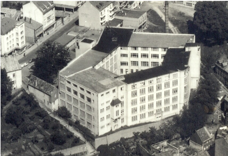
Luftbild der Schuhfabrik Kopp in Pirmasens (1960er Jahre)