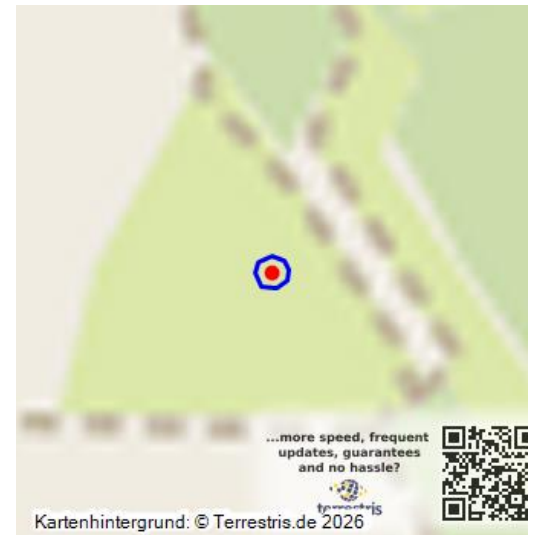
Lageskizze Affalterloch

Erstmals wird 789 im Lorscher Codex in der Gemarkung „Borg“ auf dem erhöhten Ufer eines ehemaligen Rheinarmes nordöstlich von Waldsee eine Siedlung mit Namen Affalterloch (=Holzäpfelwald) erwähnt. Dieser Ort gelangte zusammen mit der 1219 ausdrücklich genannten „grangiam de Affolteloh“ des Klosters Lorsch nach mehreren Besitzwechseln auf ungeklärte Art und Weise 1308 in die Hand der Pfalzgrafschaft bei Rhein (Vgl. Keddigkeit 4 2021, S. 61). Peter Gärtners (Gärtner, Bd. 2, 1855, S. 310) Mitte des 19. Jahrhunderts geäußerte Behauptung, es habe bereits im 13. Jahrhundert ein „Wehrlichhauß Afolterlohe“ bestanden, oder sei spätestens in Zusammenhang mit dem Immobilienwechsel zu Beginn des 14. Jahrhunderts erbaut worden, entbehrt urkundlicher Nachweise. Bis Ende der zwanziger Jahre des 14. Jahrhunderts werden lediglich Grangie und Höfe, jedoch niemals eine Burg erwähnt. Ähnlich verhält es sich mit der These, dass die Herren von Lindenberg (Burg westlich von Neustadt), die 1220 in Affolterloch ein Lehen des Klosters Weißenburg besaßen, Erbauer der Burg gewesen sein könnten (Vgl. Keddigkeit 4 2021, S. 63). Letztlich ist auch dies urkundlich nicht nachzuweisen.