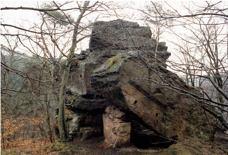
Burgruine Nonnenfels bei Bad Dürkheim (2004)