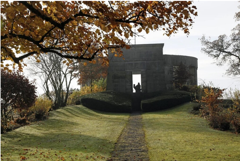
Ehrenfriedhof Daleiden (2023)