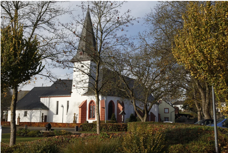
Katholische Pfarrkirche St. Matthäus in Daleiden (2023)