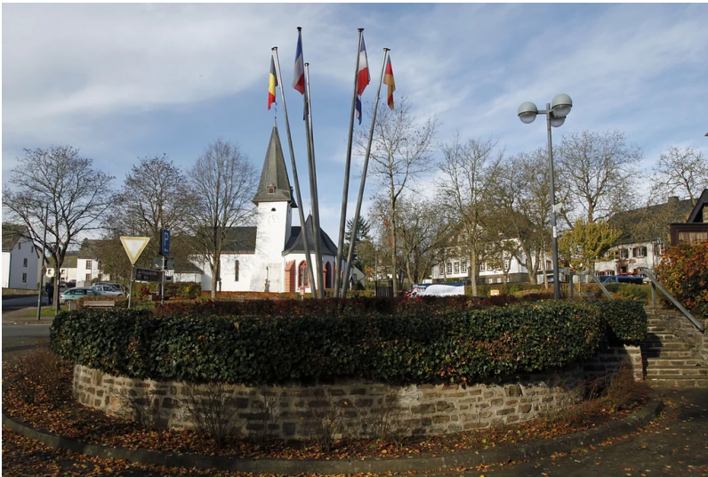
Zentrum der Ortsgemeinde Daleiden (2024)