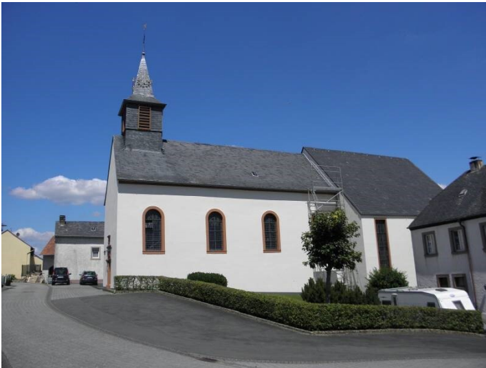
Katholische Pfarrkirche St. Urban in Gindorf (2023)