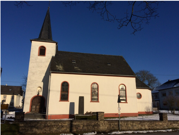
Filialkirche St. Briccius in Oberstedem (2023)