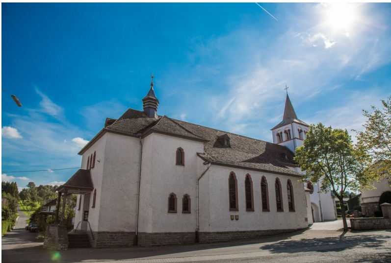
Katholische Pfarrkirche Kreuzerhöhung und St. Stephan in Fließem (2023)