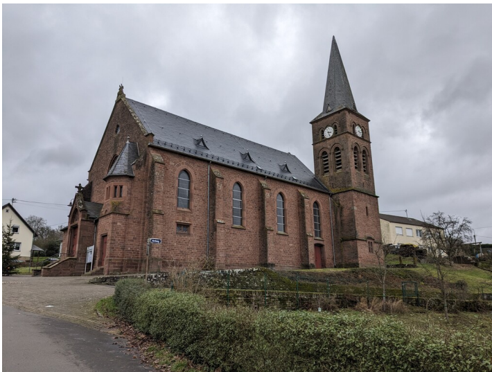
Katholische Pfarrkirche St. Martin in Bickendorf (2023)