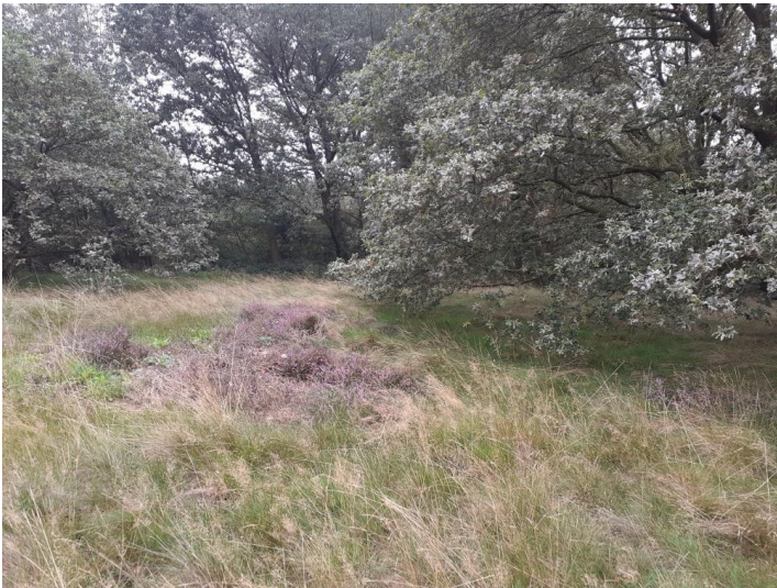
Heidekraut am Schaephuysener Höhenzug (2023)