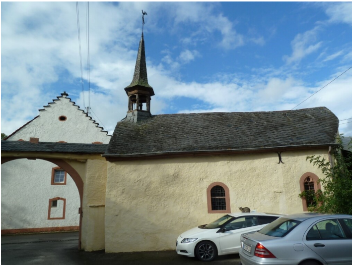
Hofkapelle in Birtlingen (2023)