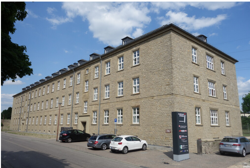
Alte Kaserne in Bitburg (2023)