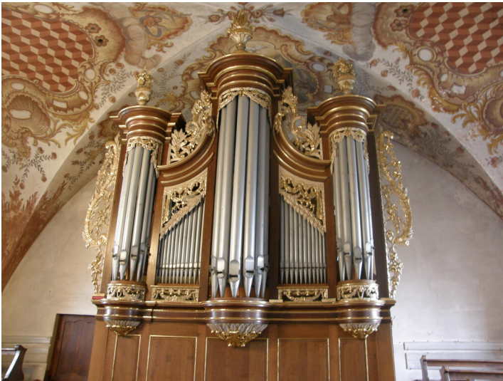
Orgel in der Kirche Sankt Martin in Briedel (2008)