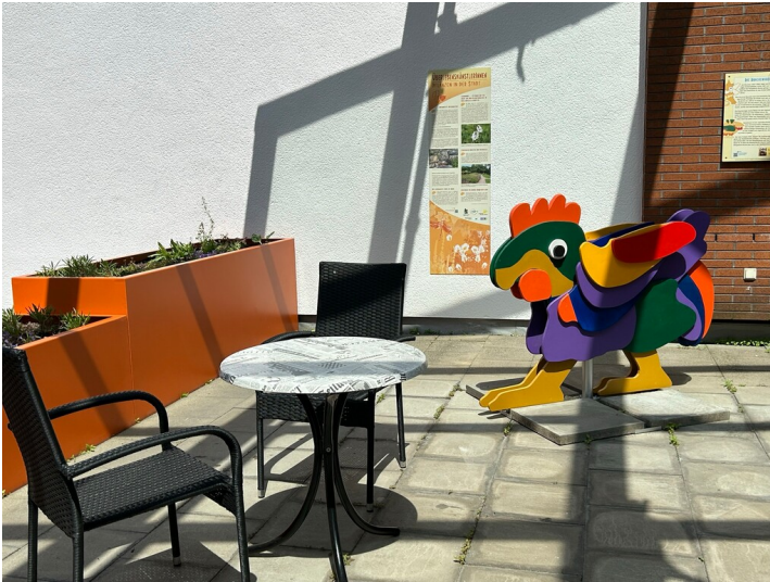
Sitzgruppe im Lesegarten