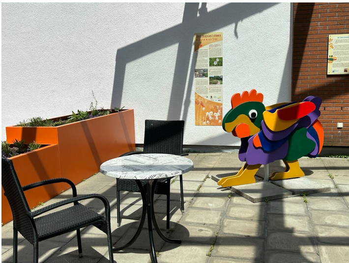
Sitzgruppe im Lesegarten