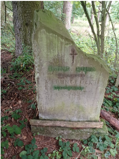
Wegekreuz im Buhkert bei Schmidt, Denkmal für Heinrich Polis (1933)