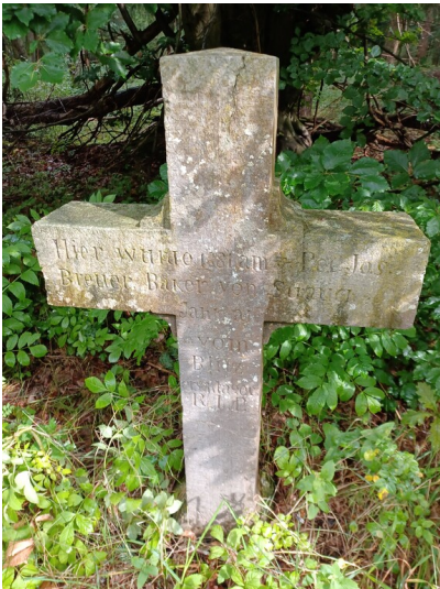
Steinkreuz im Buhlert bei Schmidt, Denkmal für Peter Jos. Breuer (1881)