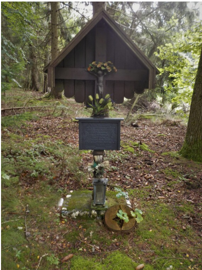
Wegekreuz im Waldgebiet Buhlert bei Schmidt, Denkmal für Waldarbeiter aus Kesternich